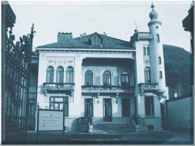
Sede della Comunità Montana Valsesia