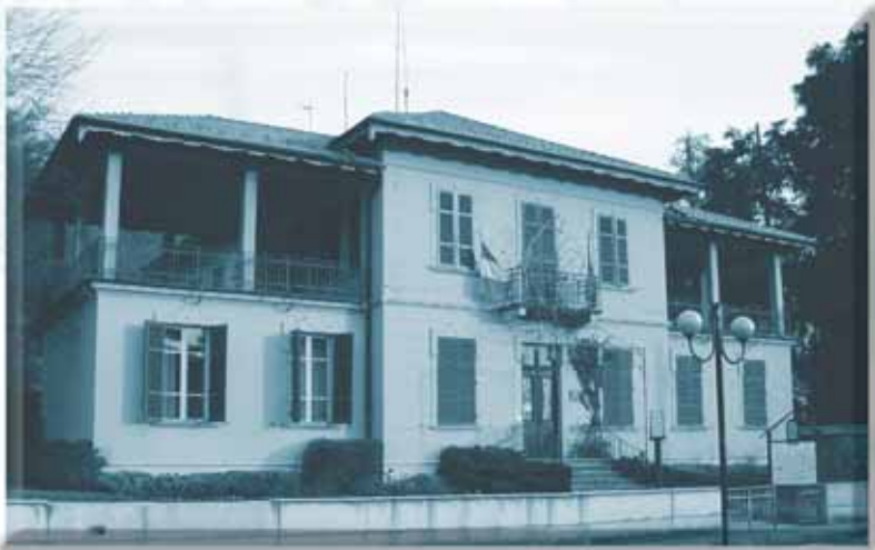
Sede della Comunità Montana Valsessera